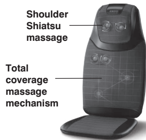
The actual product materials and fabrics may vary from the picture shown.